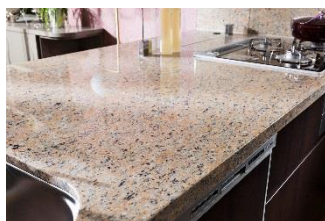
天然御影石キッチンカウンター