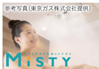
ミストサウナ付 浴室暖房乾燥機